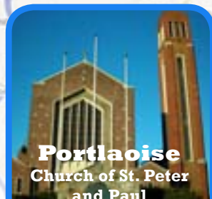
Portlaoise Church of St. Peter and Paul

Dwa razy w miesiącu, drugi i czwarty piątek, godz. 20:00.