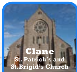
Clane St. Patrick's and St. Brigid's Church