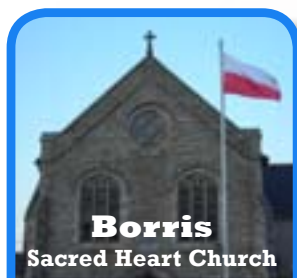
Borris Sacred Heart Church

Raz w miesiącu, czwarta sobota, godz. 19:30.