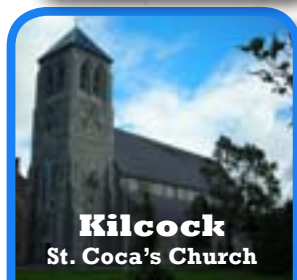
Kilcock St. Coca's Church

The date and the time of the Mass will be announced later.