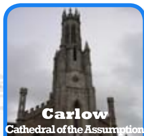
Carlow Cathedral of the Assumption

Once a month, fourth Saturday at 7.30 p.m.