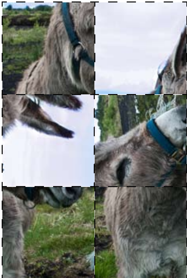
Wytnij i ułóż obrazek zwierzątka które wiozło Maryję do Betlejem

Modlitwa Panie Jezu Przyjacielu dzieci Bądź moim Przyjacielem Weź mnie za rękę i zawsze trzymaj mnie mocno Naucz mnie jak stawać się coraz lepszym Napewno wiesz jak tego dokonać Bo Ty też byłeś małym dzieckiem Nie opuszczaj mnie nigdy, kiedy jestem smutny Pozostań moim Przyjacielem Potrzebuję Cię Od początku aż do końca mego życia