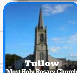
Tullow Most Holy Rosary Church

Twice a month, second and fourth Friday at 8 p.m.