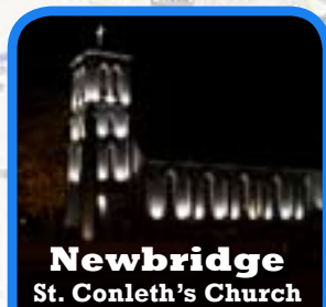
Newbridge St. Conleth's Church