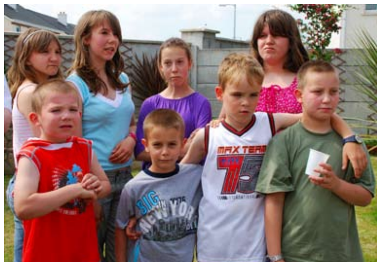
Dzieci z bielskiego domu dziecka spędzające wakacje w Irlandii

W połowie pobytu zostało zorganizowane wspólne spotkanie. Dwie rodziny udostępniły swoje domy a w przygotowaniu przyjęcia pomogli wszyscy. Przy grillu, dźwiękach gitary i śpiewach, dzieci mogły pobawić się na dmuchanym zamku a przede wszystkim mogły się wspólnie spotkać i podzielić nowymi wrażeniami. Miłą niespodzianką było dla nas to, że nasi znajomi nie związani z akcją